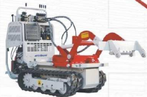
Uchwyt narzędziowy dla rolnictwa