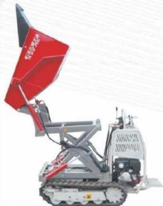
Wywrotka z regulowaną wysokością rozładunku