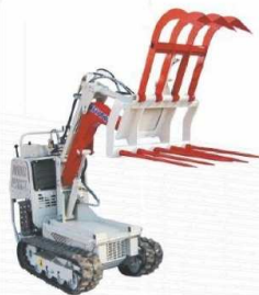
Uniwersalne widły rolnicze