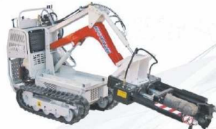
Hydrauliczne nożyce do drewna