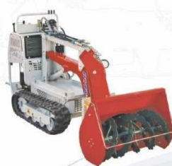
Wirnikowy pług śnieżny