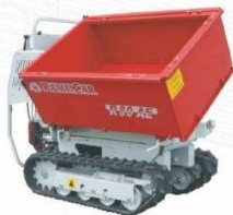
Kontener z trójstronnym rozładunkiem