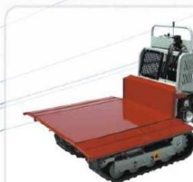
Platforma z otwieranymi bokami