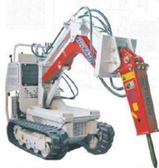
Hydrauliczny młot wyburzeniowy