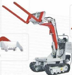
Widły do transportu palet