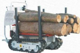
Platforma do transportu bali